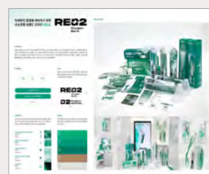
동상_IBDA Bronze 산소은행 REO2_오혜수