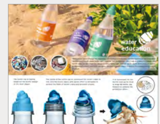
동상_IBDA Bronze water education. TSENG YUNG-TING, LEE PIN-AN, LO YI-TI, ZHANG ZHEN-YI