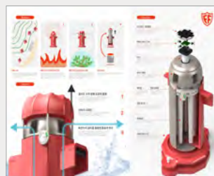
금상_IBDA Gold Forest Firewall_이광호, 이동우, 이동호