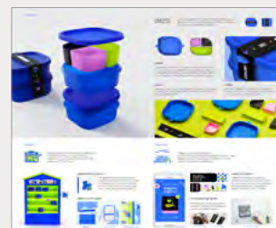
금상_IBDA Gold 티클티클_조성은, 박지민, 부흥우