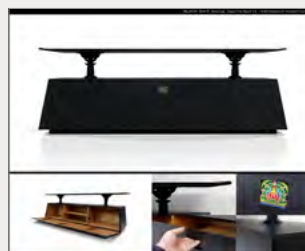
은상_IBDA Silver 검은 대문_김낙봉