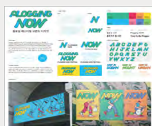
동상_IBDA Bronze 플로깅 페스티벌_조유정