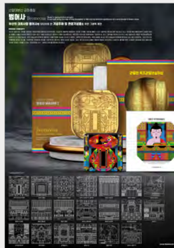
대상_IBDA Grand 범어사_원종욱