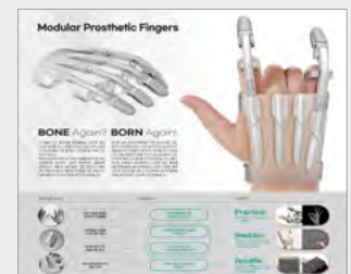
은상_IBDA Silver Modular Prosthetic Fingers_장웅, 송민걸, 황수연