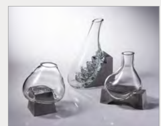
동상_IBDA Bronze Soft Vase_Cheng, Ming-Fan